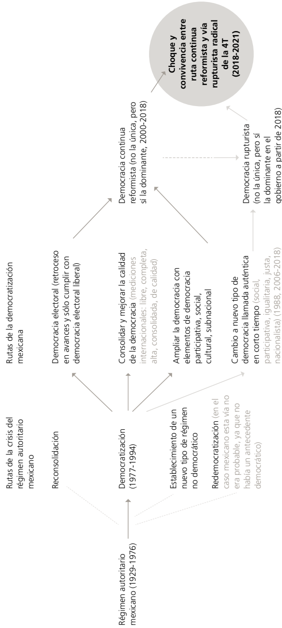
FIGURA 2. Rutas de la democratización, choque y convivencia entre modelos de democracia en México