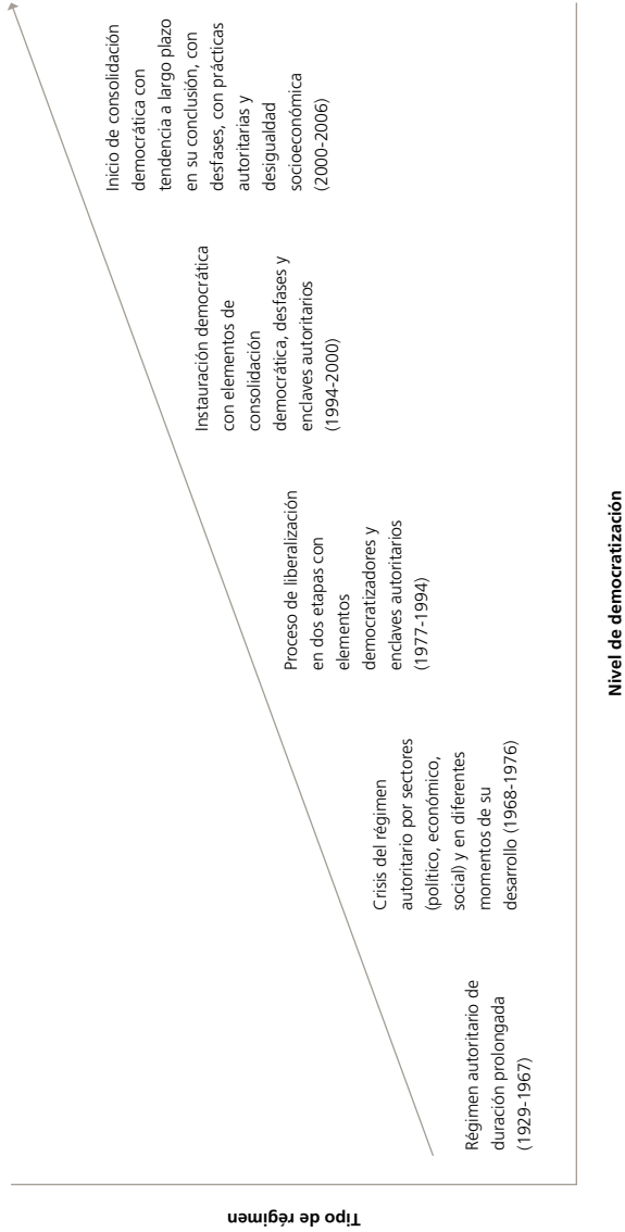
FIGURA 1. Subtipo del cambio de un régimen autoritario a un régimen democrático en su fase de inicio de consolidación (caso México)