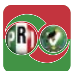
Alianza por México

En el Instituto se tomó una postura diferente que llamo ser adversarios leales.